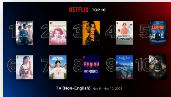
Gambar 1. 4 Top 10 Global Pada Film Series "Gadis Kretek"

dalam satu minggu saja. Pencapaian ini tidak hanya mencerminkan daya tarik naratif yang kuat dan produksi berkualitas tinggi, tetapi juga menunjukkan bagaimana konten lokal Indonesia mampu bersaing di panggung global, sebagaimana disajikan pada gambar 1.4.