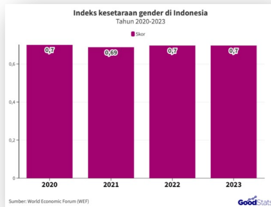
Gambar 1. 1 Indeks Kesetaraan Gender di Indonesia Pada Tahun 2020-2023