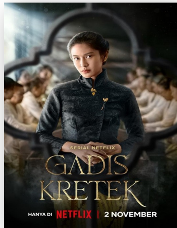
Gambar 1. 5 Poster Film Serial Gadis Kretek

tersebut. Sementara itu, penelitian lain yang dilakukan oleh (Akbar & Ardi, 2021) menitikberatkan pada isu feminisme dalam film "Mulan" versi 2020, dengan menggunakan teori semiotika John Fiske. Subjek penelitian ini adalah karakter utama dalam film tersebut, dengan objek penelitian yang mencakup elemen-elemen visual pada film "Mulan" 2020. Metode penelitian yang diterapkan adalah kualitatif dengan analisis semiotika yang hasilnya menunjukkan adanya nilai-nilai feminisme yang tercermin dalam berbagai aspek pada level realitas, seperti penampilan, tata rias, kostum, bahasa, lingkungan, dan perilaku. Namun, kedua literature review tidak membahas mengenai gerakan feminisme pada karakter utama dalam film serial "Gadis Kretek" episode ke-1.