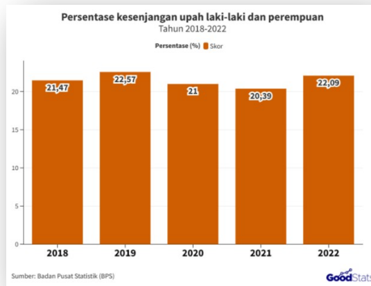
Gambar 1. 2 Persentase Kesenjangan Upah Laki-Laki dan Perempuan

Faktanya, kesenjangan gender dapat dilihat dengan perbedaan upah antara pekerja laki-laki dan perempuan yang masih terus terjadi di dunia kerja. Berdasarkan laporan dari Badan Pusat Statistika (BPS) dalam tulisan (Naurah, 2024) mencantumkan bahwa persentase kesenjangan upah menurut jenis kelamin ( gender wage gap ) di Indonesia sebesar 22,09% pada tahun 2022 yang dapat dilihat pada gambar 1.2.