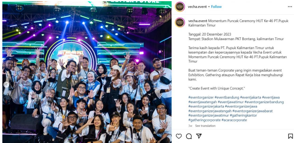
Gambar 1.4 Publikasi Event HUT PKT Ke-46

Kegiatan Customer Gathering diadakan oleh Divisi Marketing Support PT Pupuk Kalimantan Timur sebagai bentuk penguatan pemasaran komersial dan apresiasi terhadap peran pelanggan B2B yang menjadi faktor keberhasilan PT Pupuk Kalimantan Timur dalam mencetak kontribusi terbesar dari seluruh anak perusahaan Pupuk Indonesia. Acara ini diadakan untuk mengelola hubungan baik pelanggan B2B dengan perusahaan PT Pupuk Kalimantan Timur. Hal ini dilakukan dengan menampung aspirasi dan masukan dengan mendengarkan secara langsung melalui sesi Forum Group Discussion di event Customer Gathering untuk bahan evaluasi perusahaan. Pengalaman pelanggan dalam mengikuti event Customer Gathering menjadi hal yang diutamakan oleh PT Pupuk Kalimantan Timur. Melalui press release resmi PT Pupuk Kalimantan Timur (2024), pelanggan B2B menyampaikan apresiasi terhadap pelaksanaan Customer Gathering sebagai wadah untuk bertemu, berdiskusi dan meningkatkan kerjasama yang terjalin antar perusahaan.