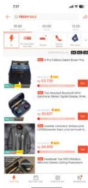
Gambar 1.4 Promosi Shopee

Berdasarkan kejadian tersebut diketahui bahwa promosi sangat penting dalam industri e-commerce untuk menarik dan mempertahankan pelanggan. Strategi promosi yang efektif di Shopee dapat berupa diskon besar-besaran, voucher , cashback , dan program loyalitas yang dirancang untuk meningkatkan frekuensi pembelian dan nilai transaksi. Berdasarkan dari promosi yang dilakukan oleh Shopee, hal ini juga sangat menarik banyaknya pembeli yang sangat ingin membeli produk mereka.