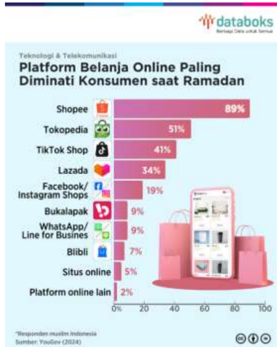
Gambar 1.3 penggunaan platform E-commerce

Peneliti mendapatkan data yang peminat e-commerce pada saat bulan april 2024 untuk mengetahui pada data penggunaan e-commerce yang terbanyak didapatkan peneliti data pada periode akhir bulan Ramadan.