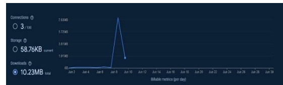
GAMBAR 1.5 Downloads Firebase

Berdasarkan gambar di atas dapat diketahui untuk uji coba yang dilakukan selama 2 minggu. Berikut adalah data yang didapat selama 2 minggu dapat diketahui total data yang di download selama 2 minggu sebanyak 17.08MB.