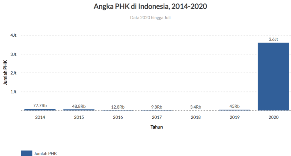
Gambar 1.1 Jumlah PHK di Indonesia Tahun 2014 – 2020