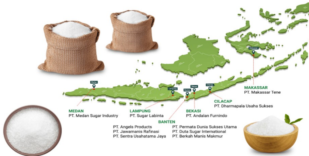
Gambar 1.1 Peta daftar 11 Anggota AGRI diseluruh Indonesia