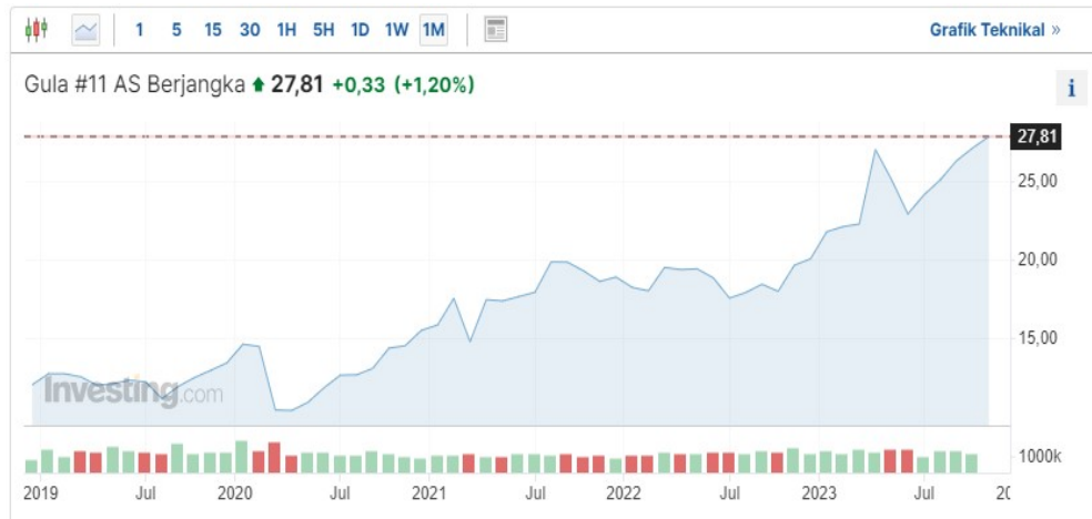
Gambar 1.3 Grafik kenaikan harga bahan mentah gula ( Raw Sugar ) dunia

Dari gambar diatas dapat dilihat bahwa harga bahan mentah gula atau raw sugar selalu mengalami peningkatan, harga raw sugar terakhir dibulan September 2023 mengalami peningkatan sekitar 1,20% yaitu menembus angka 27,81 US$ / Metric Ton (MT) atau sekitar Rp 433.530,-/Ton (dengan nilai tukar Rp 15.589,- / US$). Kenaikan harga bahan baku ini pun berdampak pula pada kenaikan harga gula dipasaran, walau pun harga jual gula rafinasi sudah ditentukan maksimal harga jual tertinggi (HET) nya oleh pemerintah namun karena tingginya harga bahan baku import menyebabkan harga jual gula pun ikut meningkat, adapun peningkatan harga jual gula di Indonesia dapat dilihat pada gambar berikut ini: