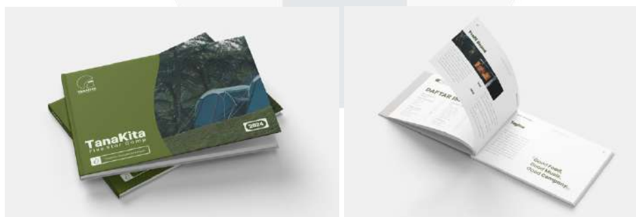
Gambar 6. Buku Graphic Standard Manual

Standar Manual Grafis dirancang sebagai panduan untuk penggunaan identitas visual dari brand Tanakita sehingga citra brand akan selalu konsisten di berbagai media yang berbeda. GSM ini berisi profil perusahaan, visual guidelines , logo guidelines , supergrafis, serta penggunaan identitas visual pada media pendukung.