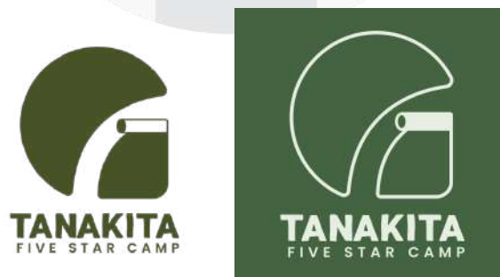
Gambar 4. Hasil Perancangan Logo

Logo yang telah dibuat juga dapat dipisahkan menjadi logomark dan logotype, sehingga konfigurasi logo dapat bersifat lebih adaptif ketika digunakan pada berbagai macam media berbeda. Ilustrasi pada logo juga dibuat dengan garis-garis melengkung, dan juga menghindari penggambaran sudut tajam untuk menggambarkan kesan aman yang ingin disampaikan oleh perusahaan. Perancangan ulang dari logo Tanakita juga disertakan dengan konfigurasi dari logo-logonya, serta standarisasi warna yang telah disesuaikan dengan color palette yang telah ditentukan.