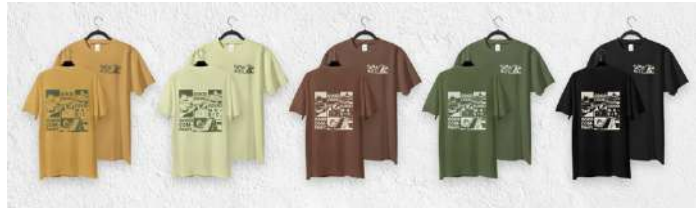
Gambar 11. Kaos Tanakita