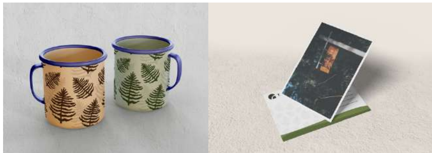
Gambar 12. Mug Enamel dan Postcard Tanakita