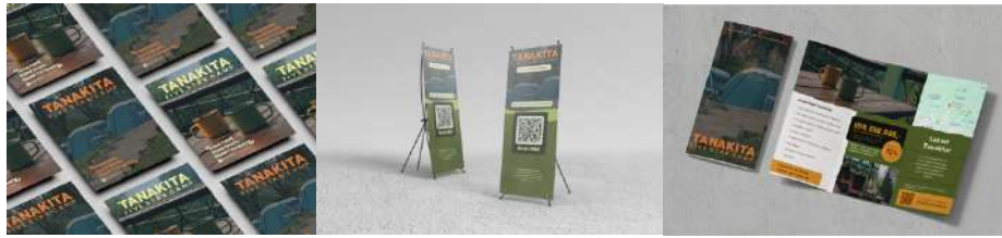
Gambar 7. Poster, X-Banner, dan Brosur Tanakita