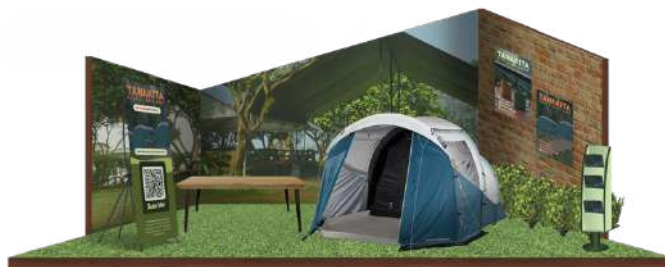
Gambar 10. Display Pameran Tanakita