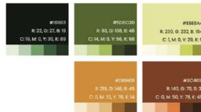
Gambar 3. Palette Warna