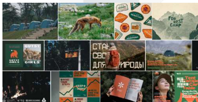
Gambar 1. Referensi Visual

Referensi visual digunakan untuk membantu mengarahkan perancangan identitas visual yang akan dibuat. Kesan yang ingin disampaikan dengan pengayaan visual brand Tanakita adalah kesederhanaan yang dapat membangun pengalaman baru.