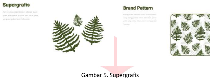
Gambar 5. Supergrafis

Supergrafis yang dirancang telah dibuat untuk menggambarkan kesan sederhana, sehingga dibuat menggunakan pengayaan sketchy lineart. Elemen-elemen berikut dapat digunakan dalam perancangan media yang menggunakan identitas brand Tanakita.