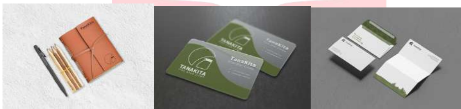
Gambar 8. Stationery Set, Kartu Nama, Amplop, dan Kop Surat Tanakita