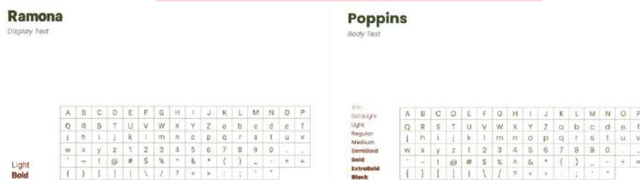
Gambar 2. Font Ramona dan Poppins

Lalu font kedua merupakan font Poppins yang berjenis sans-serif, typeface ini akan digunakan sebagai body text. Typeface ini mempunyai kesan yang sederhana dengan tingkat keterbacaan yang tinggi.