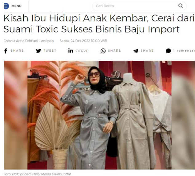
Gambar 1.2 Berita single mother sukses