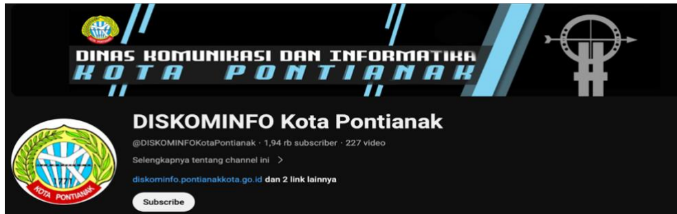
Gambar 1. 2 Profil Youtube Diskominfo Kota Pontianak

Dilansir dari Official Website Diskominfo Kota Pontianak (2023), Diskominfo Kota Pontianak adalah bagian dari instansi yang dimiliki daerah Kalimantan Barat dengan membantu untuk pelayanan kepada masyarakat dan juga membantu Walikota untuk melaksanakan urusan pemerintahan yang menjadi kewenangan daerah dan tugas pembantuan di bidang komunikasi, bidang informatika, bidang statistik dan bidang persandian dengan sesuai Peraturan Pemerintahan Nomor 18 Tahun 2016 tentang perangkat daerah dan Peraturan Daerah Kota Pontianak Nomor 7 tahun 2016 tentang Pembentukan dan Susunan Perangkat Daerah Kota.