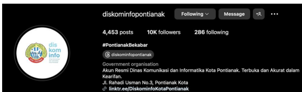
Gambar 1. 1 Profil Akun Instagram Diskominfo Kota Pontianak

Diskominfo Kota Pontianak mempunyai beberapa media sosial seperti Youtube, Website dan salah satunya Instagram untuk menyebarkan informasi yang akan di unggah. Akun Instagram yang dimiliki Diskominfo Kota Pontianak ini mempunyai followers sebanyak 10.000 dan following sebanyak 286. Akun Instagram Diskominfo Kota Pontianak ini berisi konten seputar Kota Pontianak dan juga akun Instagram Kota Pontianak ini mempunyai konten reguler yaitu Info Selintas, Tahukah Kamu, KoRABUasi, Kamis Berpantun, JuTec, Sabtu Begini dan Minggu Begitu. yang Selanjut dari akun Youtube diskominfo Kota Pontianak mempunyai subscriber sebanyak 1,94 rb, Akun Youtube Diskominfo Kota Pontianak ini membuat konten seputar kegiatan yang diadakan oleh Pemkot Kota Pontianak. Diskominfo Kota Pontianak sendiri mempunyai peran penting untuk membantu masyarakat serta membantu Wali Kota Pontianak dalam melaksanakan tanggung jawab dan tugas mereka sebagai instansi pemerintahan daerah Kota Pontianak.