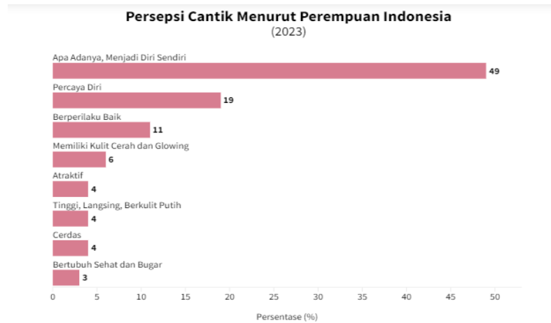
GAMBAR 1.1 GRAFIK HASIL RISET

perempuan Indonesia mengartikan cantik cerdas, tinggi, badan lan gsing, kulit putih dan atraktif. Lalu, sebanyak 3% perempuan Indonesia mengartikan cantik dengan memiliki tubuh yang sehat dan bugar ( https://dataindonesia.id/varia/detail/bagaimana-persepsi-cantik-menurut-perempuan-indonesia ).