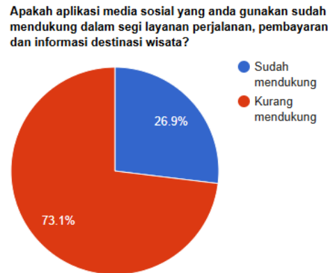
Gambar 1.1 Diagram lingkaran survei masalah

Analisa masalah juga dilakukan dengan melakukan survei kepada masyarakat umum untuk menganalisa masalah yang dihadapi mereka dengan menanyakan apakah aplikasi media sosial yang mereka gunakan sudah mendukung dalam melakukan perencanaan kegiatan berwisata atau belum.