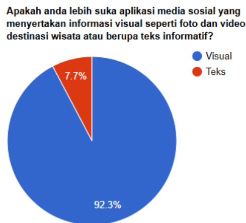
Gambar 1.2 Diagram lingkaran survei model aplikasi

Berdasarkan hasil survei yang dilakukan terhadap 26 orang responden, sebanyak 91.3% responden lebih memilih agar aplikasi media sosial menampilkan foto dan video tempat destinasi wisata dibandingkan teks informatif destinasi wisata.