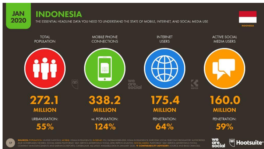
Gambar 1.1 Data Pengguna Internet di Indonesia

Khalayak sering menggunakan internet untuk berkomunikasi dan berinteraksi dengan kerabat mereka di era teknologi yang sudah jauh lebih maju ini karena adanya internet. Bahkan dalam waktu yang sangat singkat, kita dapat bertukar dan menerima informasi. Internet adalah teknologi pembantu komunikasi modern yang paling disukai oleh masyarakat (Desa Waetele dkk., 2022). Media yang menggunakan teknologi internet memungkinkan komunikasi yang lebih cepat dan efisien.