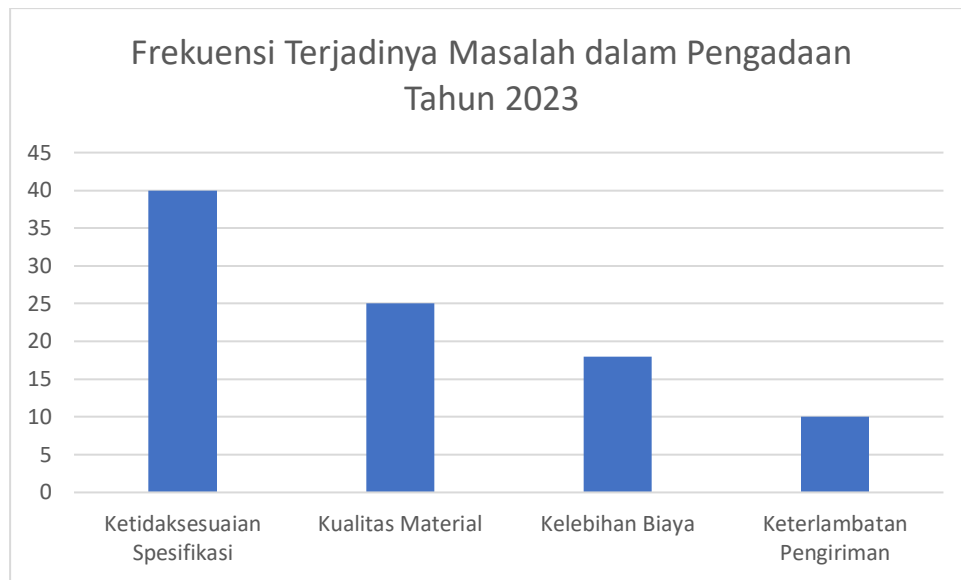
Gambar I. 2 Frekuensi Terjadinya Masalah dalam Pengadaan Tahun 2023

Selama tahun 2023, PT. Manggala Baja Perkasa mencatat 57 kesalahan dari total 93 pengadaan material yang dilakukan. Ini berarti 61,29% dari seluruh proses pengadaan mengalami masalah. Kesalahan-kesalahan ini beragam dan berkaitan dengan ketidaksesuaian spesifikasi, kualitas material yang buruk, kelebihan biaya, dan keterlambatan pengiriman.