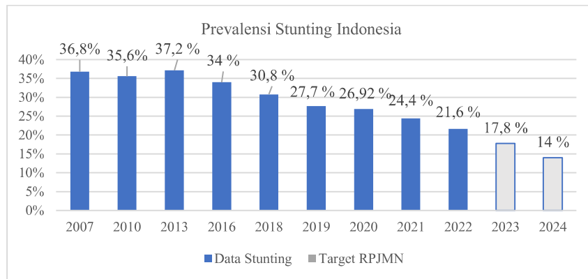
Gambar I.2 Angka Stunting 2007-2022 dan target 2024 (hasil Survei Status Gizi Indonesia)