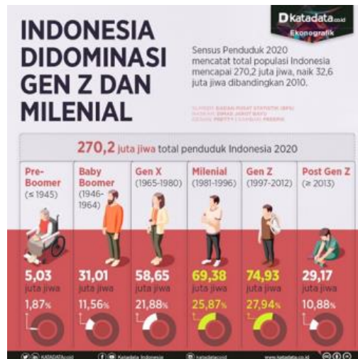
Gambar 1. 1 Sensus Penduduk 2020

Gen Z (Generasi Z) memiliki pengaruh yang signifikan dalam pemilu 2024 karena hidup di era informasi, di mana semua hal dilakukan melalui internet atau media online . Generasi ini terdiri dari orang-orang yang lebih muda yang memiliki pengetahuan yang luas yang dapat ditemukan di internet dan media massa. Teknologi digital, fleksibilitas, kecerdasan, dan fleksibilitas adalah ciri khas generasi ini. Daftar Pemilih Tetap (DPT) untuk Pemilu 2024 mencapai 204.807.222 pemilih, dengan 46.800.161 pemilih dari Gen Z (22,85% dari total) dan 66.822.389 pemilih dari milenial (33,60% dari total). Kedua generasi ini mendominasi pemilih Pemilu 2024, yakni sebanyak 56,45% dari total keseluruhan pemilih (Yolency, 2024). Namun, mereka juga memiliki kebiasaan yang tidak baik, seperti menyukai budaya instan dan kurang memperhatikan hal-hal privat. Karakteristik tersebut mempengaruhi perspektif dan tujuan hidup, termasuk sikap dan cara mereka melihat, yang mempengaruhi peran mereka (Xaverius & Priskila, 2024). Dimulai saat Pemilu tahun 2019, bermacam partai politik mengajukan tokoh elit politik yang bersaing selaku calon legislatif (Caleg) untuk periode 2019-2024 dari golongan generasi muda. Kehadiran caleg muda dari Gen Z memberikan nuansa segar dalam arena Pemilu, dan mereka yang diasumsikan mempunyai pengalaman politik yang terbatas juga membawa tantangan sendiri dalam kontestasi Pemilu tahun 2019 (Syamsuar & Andini, 2020).