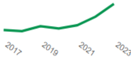
Gambar 1. 1 Data KBG terhadap Perempuan 2017-2023