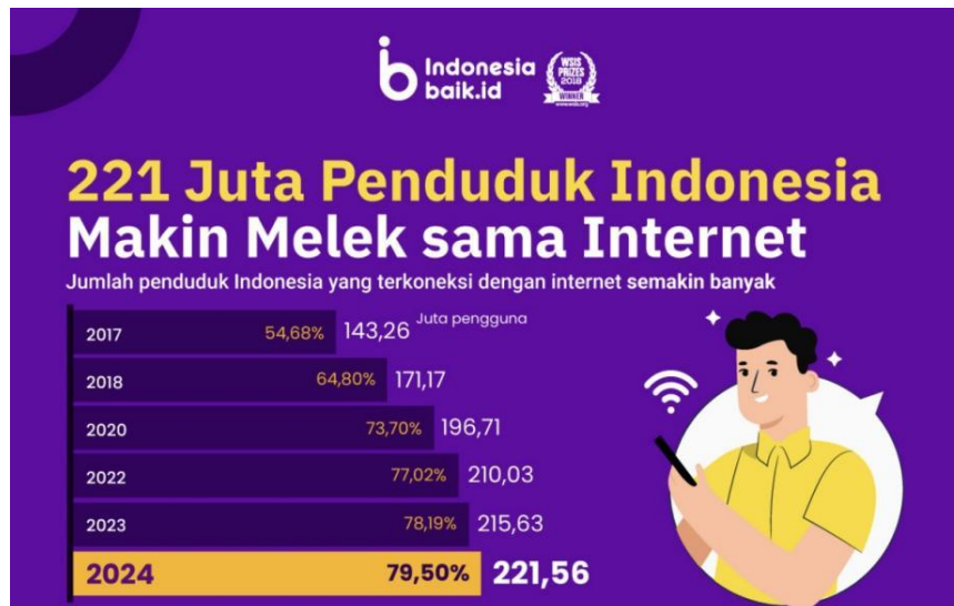
Gambar 1. 1 Data Pengguna Internet di Indonesia Tahun 2024

Perkembangan teknologi komunikasi telah membawa perubahan signifikan dalam pola komunikasi manusia (Oktavia 2016). Dengan populasi lebih dari 270 juta orang, Indonesia merupakan salah satu negara dengan pertumbuhan pengguna internet yang pesat. Pada tahun 2024 diperkirakan sekitar 221 juta penduduk Indonesia sudah mengakses internet, menggambarkan tingkat penetrasi yang sangat tinggi (Databoks 2024). Fenomena ini merupakan hasil dari perkembangan teknologi informasi dan komunikasi yang pesat serta penetrasi smartphone yang meluas. Indonesia memiliki salah satu jumlah pengguna internet terbesar di dunia, dengan pertumbuhan yang terus meningkat seiring dengan adopsi teknologi digital (We Are Social & Hootsuite, 2024). Penelitian yang dilakukan oleh Pew Research Center juga menunjukkan bahwa internet telah menjadi alat penting dalam akses informasi. Mereka melaporkan bahwa dengan meningkatnya akses internet, masyarakat memiliki lebih banyak kesempatan untuk memperoleh informasi yang relevan dan berpartisipasi dalam platform digital (Pew Research Center, 2024).