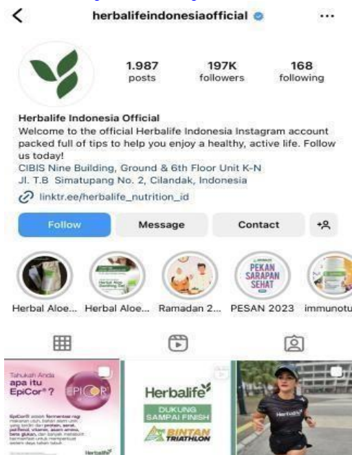
Gambar 1. 5 Akun Instagram Herbalife