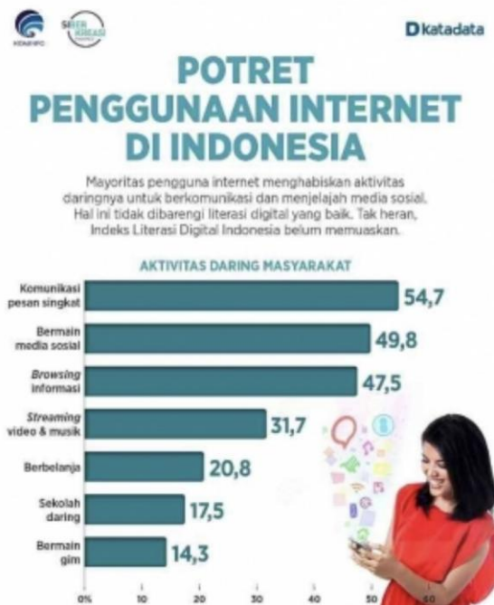
Gambar 1. 2 Potret Pengguna Internet di Indonesia