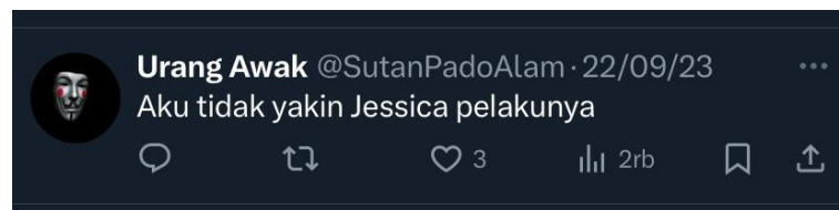
Gambar 1.4 Komentar Film Ice Cold