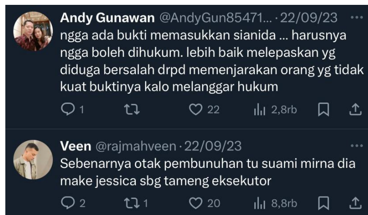
Gambar 1.2 Komentar Film Ice Cold

Komentar-komentar netizen mengenai film dokumenter "Ice Cold: Murder, Coffee and Jessica Wongso" mencerminkan berbagai reaksi dan tingkat keraguan yang ada di masyarakat terkait kasus tersebut. Komentar gambar 1.1 menunjukkan kebingungan dan ketidakpastian mengenai apakah Jessica Wongso mengaku sebagai pelaku atau tidak, serta menyinggung teori konspirasi yang menyebutkan kemungkinan keterlibatan suami korban sebagai pelaku utama. Ini menunjukkan bagaimana film dapat memicu spekulasi dan teori-teori alternatif di kalangan penonton, menggambarkan betapa kompleksnya persepsi publik tentang kasus yang melibatkan banyak elemen misterius dan kontroversial.