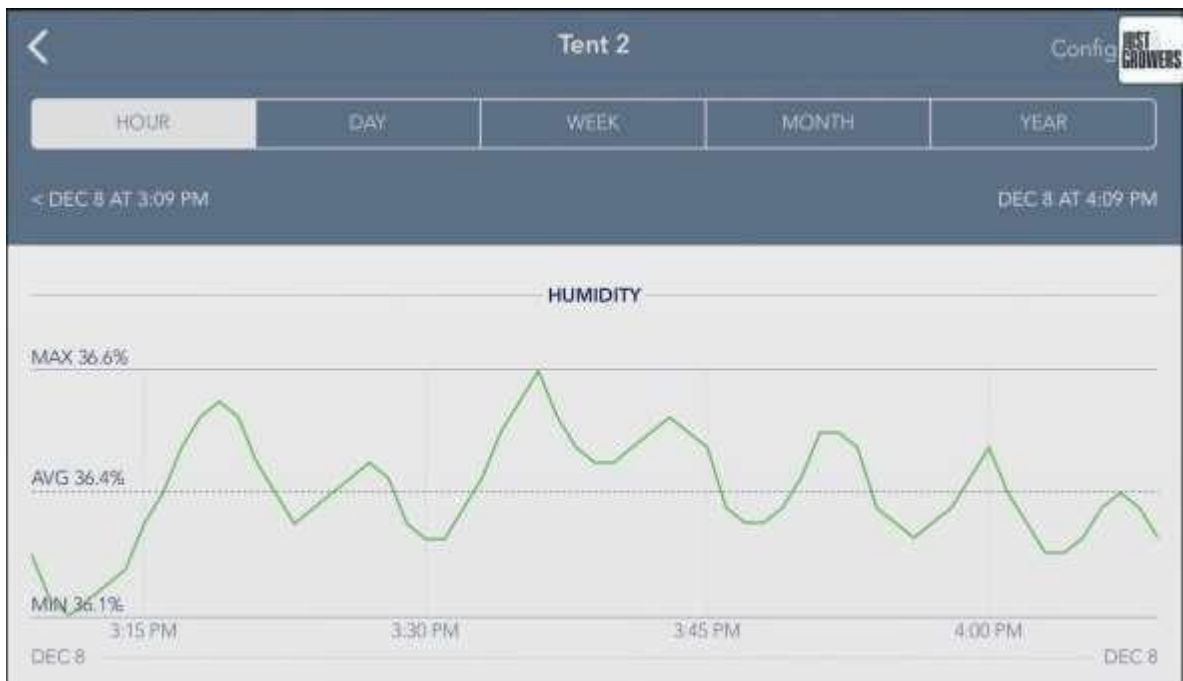
Gambar 1. 3 Grafik hubungan Kelembaban Grow Tent

Permasalahan selanjutnya yang sering terjadi pada alat grow tent saat ini yaitu memiliki tingkat kelembaban yang rendah, pada fase vegetatif, penting untuk menjaga kelembaban di atas 50%, namun yang terjadi pada grow tent yang hadir saat ini masih kesulitan dalam menyesuaikan tingkat kelembaban yang akurat.