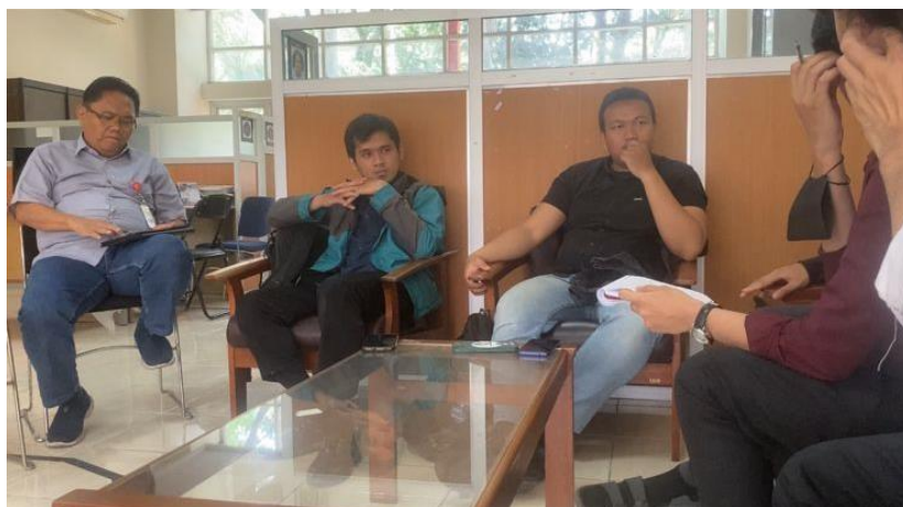
Gambar 1. 5 Diskusi Bersama dengan mitra