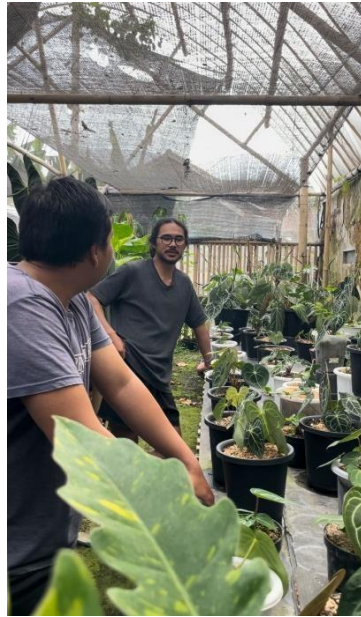
Gambar 1. 4 Wawancara dengan Petani Anthurium

Berdasarkan beberapa referensi yang telah diambil dari daftar pustaka, ada juga referensi lain yang kami ambil dari wawancara langsung terhadap mitra/client produk URBANISCAPE ini, berikut merupakan rangkuman dan dokumentasi hasil wawancara :