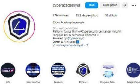
GAMBAR 1. 6

Profil Akun Instagram @cyberacademyid dari PT Global Inovasi Siber Indonesia