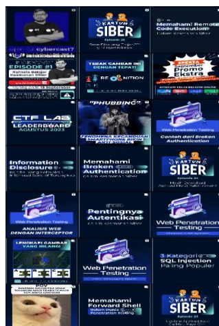
GAMBAR 1. 7

Isi Konten Akun Instagram @cyberacademyid