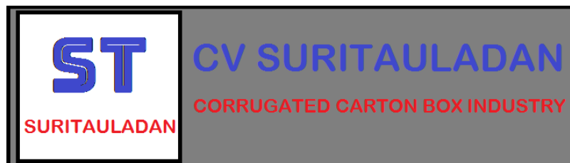
Gambar 1.1 Logo perusahaan

Perusahaan pada umumnya memiliki logo, untuk memberikan simbol dan memudahkan konsumen dalam mengenal produk. Adapun logo dari perusahaan ini adalah sebagai berikut: