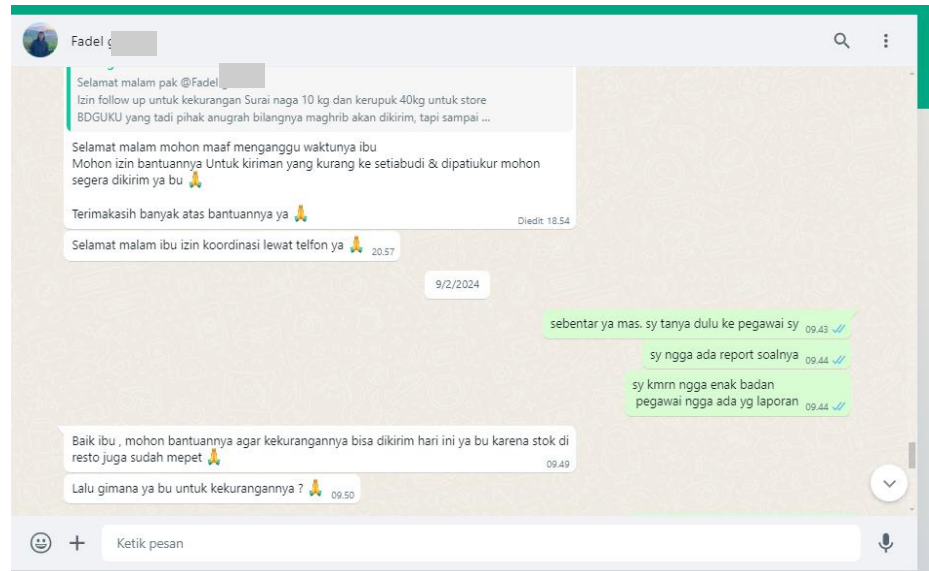
Gambar 1.1 Komplain Pihak Pembeli melalui Pesan Pribadi

masalah yang terjadi pada Anugrah Frozen Food yaitu kurangnya kejelasan dalam instruksi kerja yang diberikan oleh pimpinan kepada karyawan, yang sering menjadi kendala utama bagi karyawan dan berdampak pada kinerja mereka saat mencapai tujuan kerja.