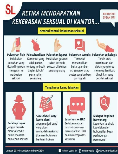
Gambar 1. 2 Ketika mendapatkan kekerasan seksual di kantor

Gambar 2 menjelaskan bahwa jika seorang karyawan mengalami pelecehan seksual di lingkungan kantor, langkah-langkah yang sebaiknya diambil meliputi sikap tegas, mencatat detail pengalaman, melaporkan ke departemen Sumber Daya Manusia (HRD), dan akhirnya melaporkan ke pihak berwenang. Tindakan-tindakan ini membutuhkan kerjasama erat dengan berbagai departemen dalam perusahaan, termasuk sumber daya manusia, hukum, dan manajemen senior.