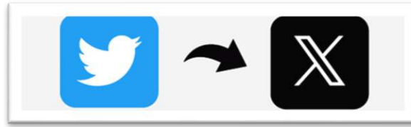
Gambar 1.1 Logo Twitter sebelum dan setelah rebranding

Pada gambar di atas menunjukkan, perbedaan pada logo Twitter yang lama dengan yang baru, Elon Musk mengganti logo burung tersebut menjadi X, menurut nya logo X menggambarkan eksplorasi, eksperimen, dan ekspresi namun perubahan ini tidak hanya sekadar mengganti logo, melainkan melakukan rebranding menyeluruh seperti perubahan nama menjadi X, bahkan slogan yang terbaru nya yaitu “ Blaze Your Glory ”, dan mengubah identitas mereknya menjadi "X" dan mengadopsi nama bisnis "X Corp". Dilansir BBC 2023 rebranding yang dilakukan Elon Musk bertujuan untuk memperbarui citra merek itu sendiri. Rebranding yang dilakukan Elon Musk terhadap Twitter mengejutkan banyak pengguna media sosial khususnya pengguna twitter itu sendiri. Rebranding tersebut, Elon lakukan secara bertahap mulai dari perubahan logo huruf X dengan tampilan yang simpel. Twitter tidak hanya sekadar mengganti logo, melainkan melakukan rebranding menyeluruh dengan mengubah identitas mereknya menjadi "X" dan mengadopsi nama bisnis "X Corp" (Stokel-Walker, 2023). Selain itu, domainnya pun berubah dari Twitter.com menjadi X.com.