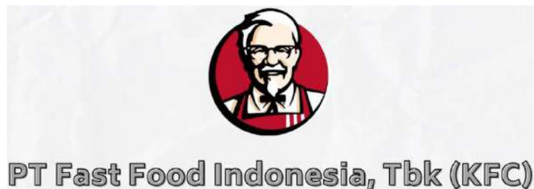
Gambar 1. 1 Logo PT. Fastfood Indonesia, Tbk (KFC)

Berikut merupakan logo PT. Fastfood Indonesia, Tbk (KFC) yang dapat dilihat pada Gambar 1.1 dibawah ini