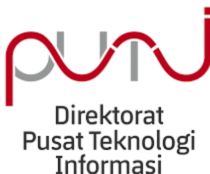
GAMBAR 1. 1

Logo Direktorat Pusat Teknologi Informasi (PuTi)