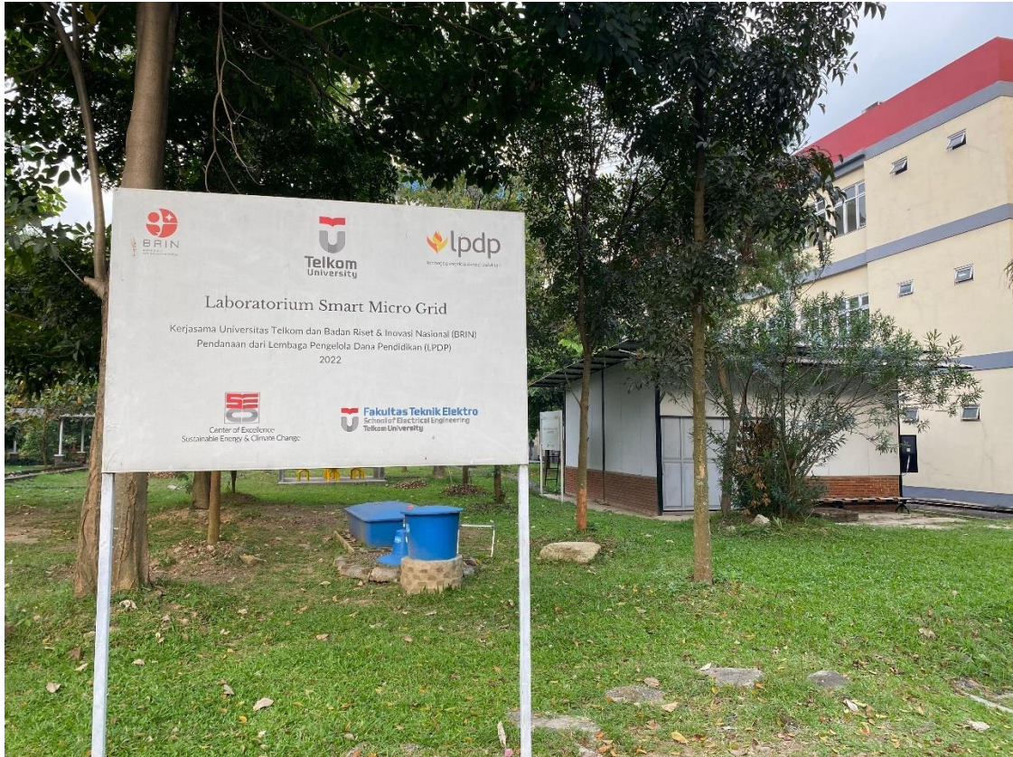
Gambar 1.1 Lokasi PLT Telkom University

Beberapa pembangkit listrik yang berada di Small Hydro Power Plant Laboratory Telkom University adalah: