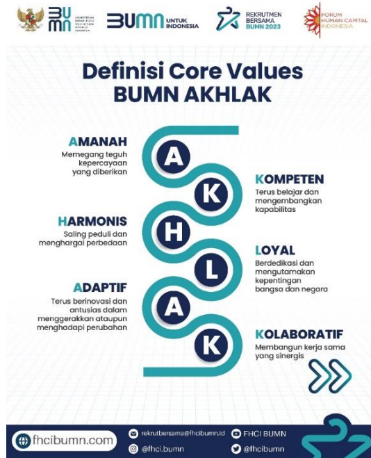
Gambar 1.2 Core Value AHLAK BUMN