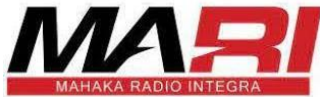
GAMBAR 1. 1