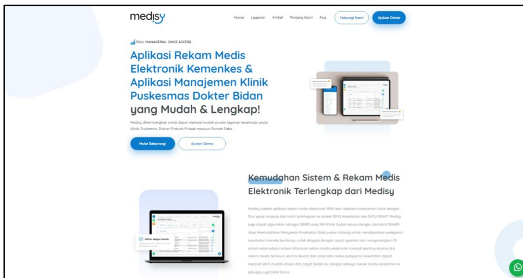
Gambar 1.1 Tampilan Website Medisy

Medisy merupakan aplikasi rekam medis Kemenkes dan manajemen klinik Puskesmas Dokter Bidan yang digunakan untuk mempermudah proses layanan kesehatan pada Klinik, Puskesmas, Dokter Praktik Pribadi maupun Rumah Sakit. Aplikasi ini memiliki banyak fitur yang telah tersedia untuk membantu dalam memajemen klinik dengan fitur yang beragam. Akses pendapatan dan pengeluaran, sistem gudang apotek, kasir dan penjualan eksternal, dan masih banyak lagi fitur yang dapat di manfaatkan dari aplikasi ini untuk kemudahan para dokter maupun pasien yang menggunakannya [9].