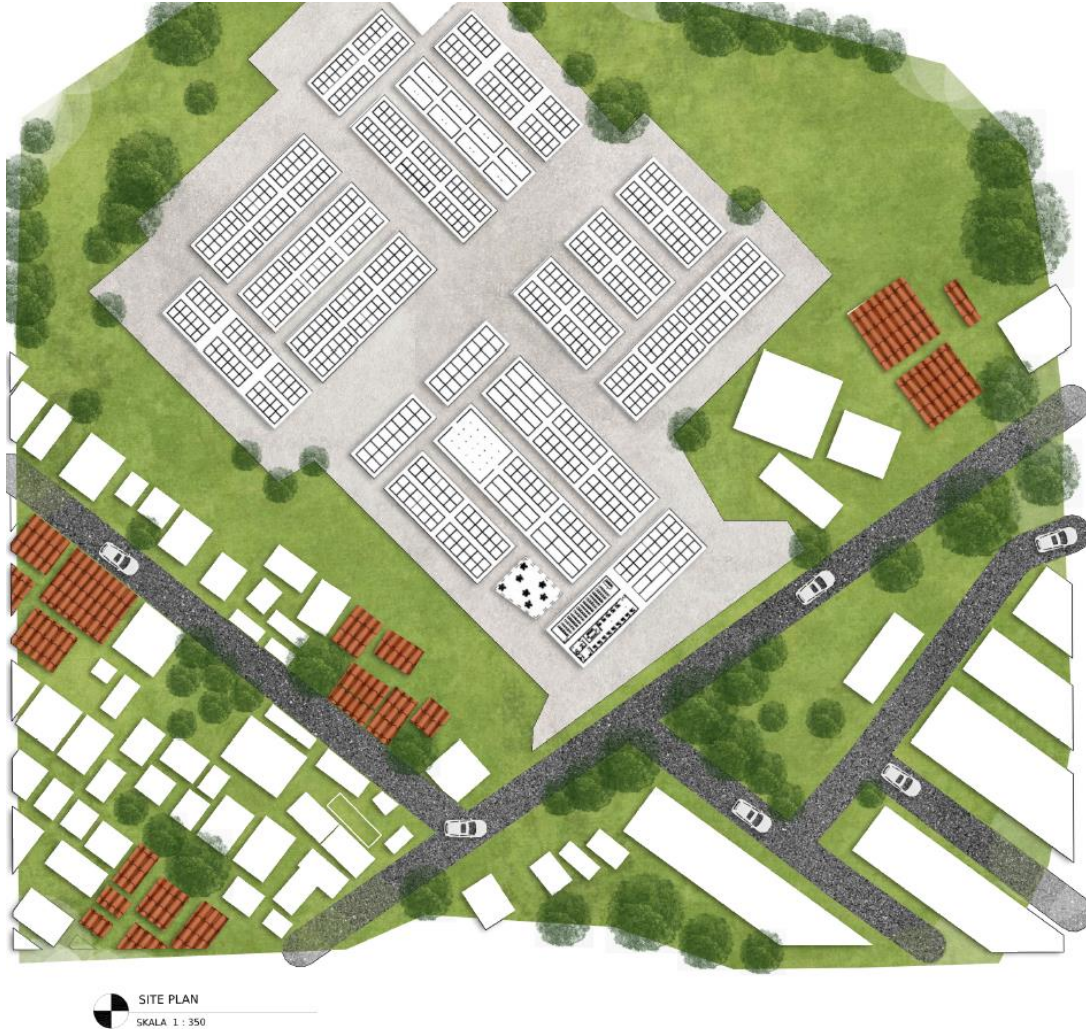
Gambar 1 Site Plan

Batasan Perancangan pada Pasar Daerah Indramayu ini Yaitu sebagai berikut: