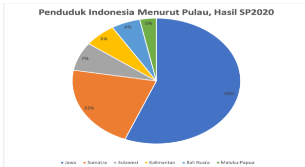
Gambar 1.1 Hasil Sensus Penduduk Pulau Jawa Tahun 2020

Gambar 1.1 menunjukkan bahwa pada tahun 2020, Jawa memiliki 151,6 juta penduduk, dengan 71,13% di usia kerja (BPS). Investor adalah siapa pun yang berinvestasi untuk memperoleh keuntungan, dan neurofinance mempelajari bagaimana aktivitas otak memengaruhi keputusan finansial, termasuk toleransi risiko (Ceravolo et al., 2021). Teknologi telah mempengaruhi industri keuangan, termasuk pemetaan SDM (Santoso et al., 2021). Pada kuartal II 2023, investasi menyumbang pertumbuhan ekonomi Indonesia sebesar 4,36% (OJK), dengan 11,5 juta investor, di mana 80,44% adalah generasi milenial dan Z.