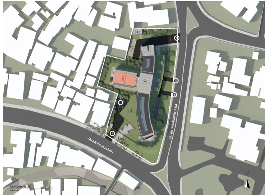
1.5.1.1 Gambar 1 1 Denah Lokasi Proyek