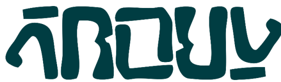
Gambar 1. 1 Logo Rumah Kopi Abdul

Gambar 1.1 menunjukkan logo dari Rumah Kopi Abdul yang dapat dibaca menjadi Abdul. Rumah Kopi Abdul adalah sebuah kafe atau coffee shop yang berada di Kota Bandung, Jawa Barat. Lokasi tepatnya berada di Jl. Ciliwung Dalam No. 1, Bandung. Tema kafe yang diusung oleh Rumah Kopi Abdul ialah homey, cozy, juga comfortable dengan suasana rumah tua dan taman. Tema tersebut sangat cocok bagi siapa saja yang ingin berdiskusi juga bertukar cerita dengan nuansa yang nyaman juga santai layaknya rumah. Jam buka dari Rumah Kopi Abdul dimulai pada pukul 10.00 hingga 00.00 WIB. Adapun visi, misi, serta struktur organisasi tentunya dimiliki oleh Rumah Kopi Abdul untuk menjalankan aktivitas operasionalnya. Diantaranya ialah sebagai berikut: