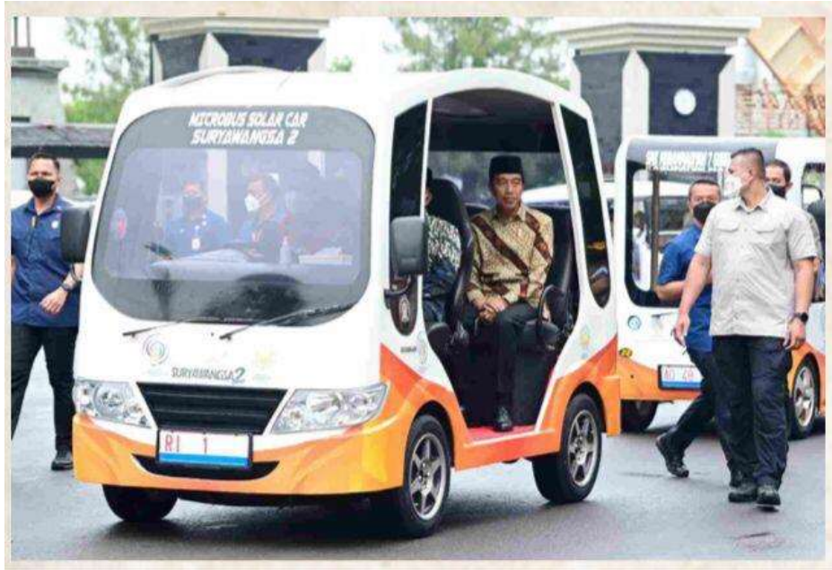
Gambar 1. 3 Suryawangsa 2 Arjuna 4.0

Pendidikan vokasi akan terus diupayakan oleh Kemendikbudristek untuk diselaraskan dan beriringan dengan entitas bisnis baik SMK dan Perguruan Tinggi untuk mempersiapkan SDM terampil di sektor industri kendaraan listrik atau EV dan energi terbarukan lainnya. Seperti SMK Muhammadiyah 7 Gondanglegi, penerima program SMK Pusat Keunggulan, memberikan solusi terhadap kelangkaan energi dan kerusakan lingkungan akibat gas buang kendaraan. Mereka mengembangkan mobil listrik dua penumpang bernama Suryawangsa 2 Arjuna 4.0, yang menggunakan tenaga surya. Proyek ini melibatkan guru dan siswa SMK Muhammadiyah 7 Gondanglegi serta berkolaborasi dengan Laboratorium Power System Operation and Control ITS. Mobil ini membutuhkan waktu pengerjaan selama 6 bulan dan telah diuji oleh Presiden Joko Widodo saat menghadiri muktamar Muhammadiyah 2022 [7].