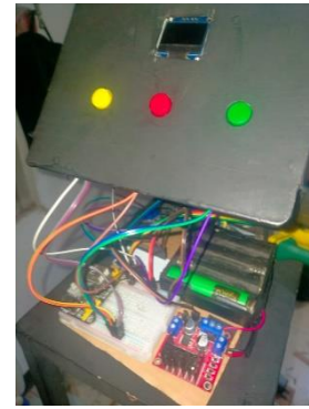
Gambar 2 electrical box pada alat injection molding

Perancangan sistem ini mengandalkan ESP32 sebagai unit control. ESP32 mengandalkan termokopel tipe-K sebagai sensor suhu dengan modul Max 6675 untuk mengubah tegangan listrik dari termokopel menjadi nilai digital untuk diproses oleh ESP32. Untuk menunjukkan informasi data suhu, kondisi dan setpoint, digunakan OLED 0.96 inch sebagai display tertanam pada alat injection molding . Dilengkapi juga push button untuk merubah setpoint