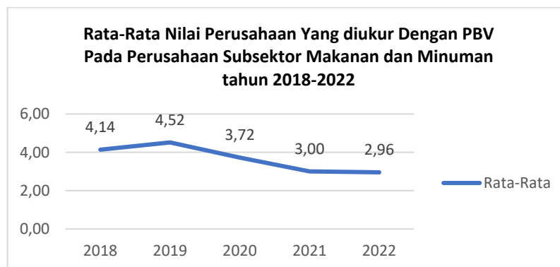
Gambar 1. 2 PBV Subsektor Makanan dan Minuman

nilai pasar saham ditentukan oleh mekanisme permintaan dan penawaran di Bursa Efek Indonesia, yang terlihat pada harga listing. Harga saham di pasar mencerminkan hasil dari kebijakan manajemen perusahaan, kinerja perusahaan, serta informasi yang telah diungkapkan kepada publik, yang memungkinkan para pemangku kepentingan membuat keputusan untuk berinvestasi, baik dengan membeli maupun menjual saham (Rivandi, 2018). Nilai sebuah perusahaan dapat diukur menggunakan beberapa rasio, salah satunya adalah rasio price to book value . Rasio ini penting karena harga pasar saham mencerminkan penilaian investor terhadap setiap ekuitas yang dimiliki perusahaan (Wulandari & Purbawati, 2021). Harga saham yang tinggi mencerminkan kesejahteraan pemilik perusahaan dan kemakmuran pemegang saham. Bertambahnya permintaan terhadap saham perusahaan akan membuat investor menilai saham tersebut lebih tinggi, sehingga nilai PBV meningkat yang berarti nilai perusahaan juga meningkat (Halim, 2021).