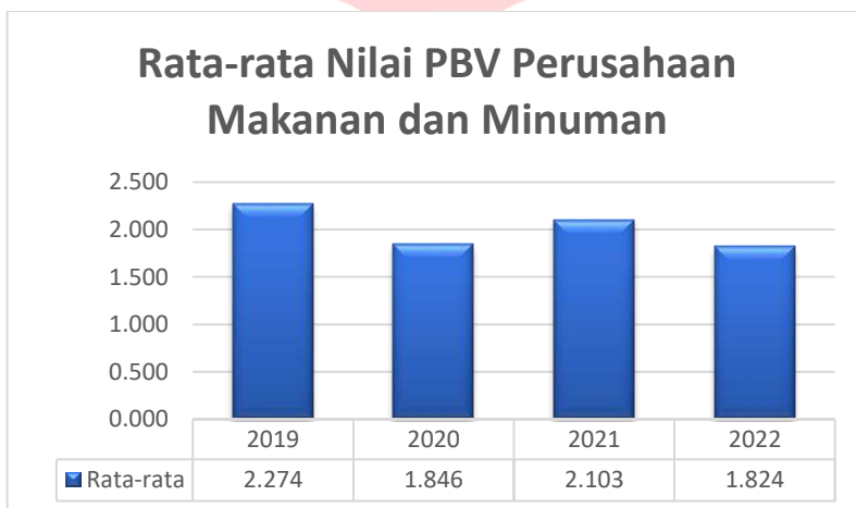
Gambar 1.2 Rata-rata Nilai PBV Sub Sektor Makanan dan Minuman Tahun 2019-2022