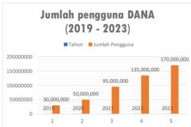
Gambar 1.1 Jumlah Pengguna DANA tahun 2019-2023

dompet digital. Dompet elektronik memungkinkan pelanggan menyimpan uang secara digital dengan aman dan nyaman dan melakukan berbagai aktivitas keuangan secara online. Di Indonesia sendiri sudah banyak layanan dompet digital yang membantu pengguna dalam melakukan transaksi secara digital seperti aplikasi DANA, OVO, Go Pay, Shopee Pay, Link Aja dan masih banyak lagi. DANA adalah sebuah aplikasi fintech yang membantu pengguna dalam melakukan transaksi secara mudah, cepat, dan aman. Aplikasi DANA diluncurkan pada 5 November 2018 oleh PT. Espay Debit Indonesia. DANA dengan teknologi inklusifnya merupakan instrumen penting bagi ekosistem ekonomi baru dan titik kontak awal terhadap layanan keuangan. DANA merupakan dompet digital yang secara resmi terdaftar di Bank Indonesia.