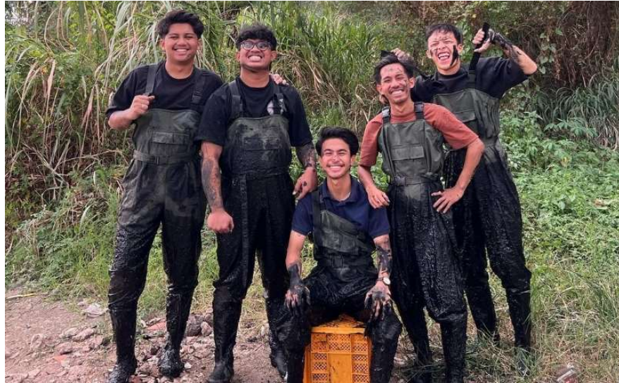
Gambar 1. 3 Anggota Pandawara Group

baik (Fauzy Muhammad, 2023). Per-tanggal 19 Mei 2024, akun sosial media TikTok Pandawara Group mempunyai 8,4 Juta pengikut dan 174,9 juta likes, sedangkan Instagram mereka mempunyai 2,5 juta pengikut.