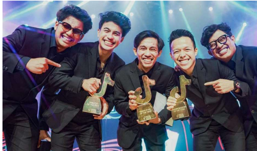
Gambar 1. 4 Pandawara Group TikTok Awards 2023

et al., n.d.). Berdasarkan pada gambar 1.4 di bawah, melalui aksinya Pandawara group berhasil menjadi content creator pertama dalam Sejarah TikTok Awards Indonesia, pada acara TikTok Awards Indonesia 2023 Pandawara Group mendapatkan 3 penghargaan utama yaitu Creator of The Year , Rising Star of The Year , dan Changemakers of The Year (Fachri, 2023)