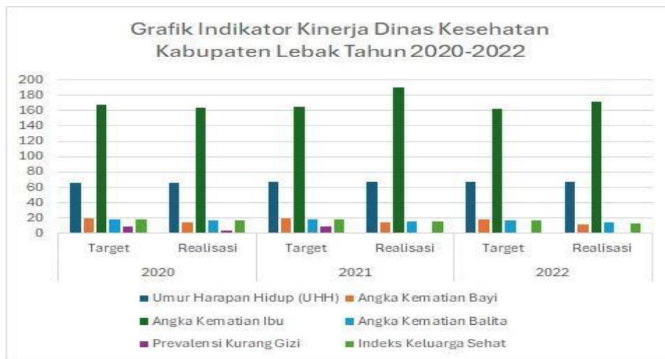
Gambar 1. 3 Grafik Capaian Kinerja Organisasi Berdasarkan Indikator Strategis

Adapun berikut ini adalah gambar grafik dari perbandingan capaian kinerja Dinas Kesehatan Kabupaten Lebak pada tahun 2020, 2021, dan 2022: