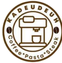
Gambar 1. 1 Logo Kopi Kadeudeuh