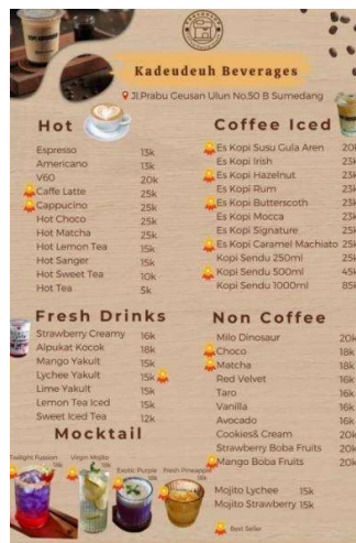
Gambar 1. 2 Menu Kopi Kadeudeuh