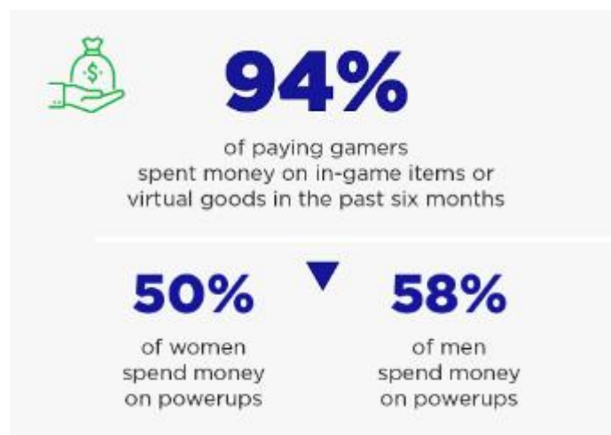
Gambar 1. 3 Gamers spent money in-game items

Dalam konteks ini, data menunjukkan bahwa 69% dari Generasi Z bersedia mengeluarkan uang dalam enam bulan terakhir untuk pembelian dalam game , menciptakan tren Compulsive Buying yang perlu diwaspadai.