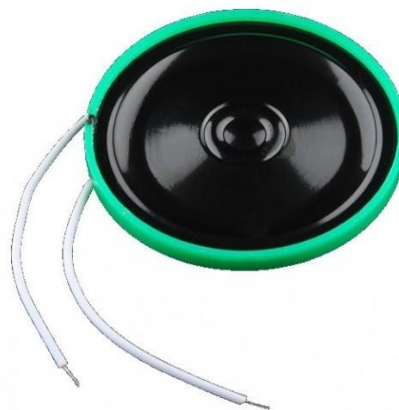
Gambar 1.2 Contoh Speaker

Rentang frekuensi speaker juga memainkan peran penting, karena burung memiliki kemampuan pendengaran yang berbeda dengan manusia. Penggunaan frekuensi yang tepat dapat efektif mengganggu burung. Rentang frekuensi umum yang digunakan dalam pengusir burung berkisar antara 20 kHz hingga 40 kHz. Selain itu, speaker yang digunakan sebagai pengusir burung harus tahan terhadap kondisi cuaca yang beragam karena sering ditempatkan di luar ruangan. Speaker yang tahan air, tahan terhadap debu, dan tahan terhadap perubahan suhu ekstrem akan memiliki umur yang lebih panjang dan kinerja yang lebih baik dalam jangka panjang. Terakhir, speaker yang fleksibel dalam posisi dan penempatan juga penting. Kemampuan untuk dipasang pada tiang atau ditempatkan di tempat strategis akan membantu mengoptimalkan efektivitas pengusiran burung dengan memungkinkan suara menjangkau area yang diinginkan dengan lebih baik.