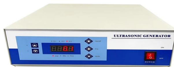
Gambar 1.1 Contoh Generator Ultrasonik

Keandalan dan tahan air juga menjadi pertimbangan penting. Alat pengusir burung sering ditempatkan di luar ruangan atau di lingkungan yang tidak terlindungi, sehingga generator ultrasonik harus dirancang dengan tingkat keandalan yang tinggi dan tahan air. Ini akan memastikan kinerja yang konsisten dan melindungi generator dari kerusakan akibat kondisi lingkungan yang keras. Koneksi dan integrasi menjadi faktor penting dalam penggunaan generator ultrasonik. Generator ini harus mudah terhubung dengan transduser ultrasonik atau perangkat pengusir burung lainnya. Pilihan konektivitas dan integrasi yang fleksibel memungkinkan generator terhubung dengan komponen lain dalam sistem pengusir burung, seperti sensor gerak, kontrol jarak jauh, atau sistem pemantauan.