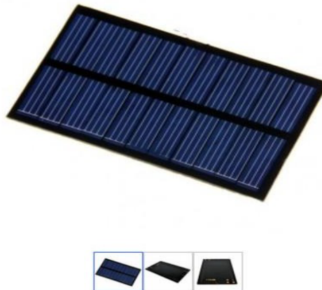
Gambar 1.3 Contoh Panel Surya

beberapa sel surya yang mengkonversi energi matahari menjadi energi listrik. Ketika sinar matahari jatuh pada panel surya, partikel-partikel cahaya (foton) akan mengenai sel surya dan menyebabkan pergerakan elektron. Gerakan elektron ini menghasilkan aliran listrik yang dapat digunakan untuk mengisi baterai atau langsung menggerakkan komponen sistem pengusir burung. Dalam sistem pengusir burung berbasis ultrasonik, panel surya dapat terhubung ke baterai untuk menyimpan energi yang dihasilkan saat sinar matahari cukup. Baterai tersebut kemudian dapat digunakan untuk memberi daya pada mikrokontroler, sensor PIR, speaker ultrasonik, dan komponen lainnya dalam sistem. Dengan demikian, energi surya memungkinkan sistem pengusir burung untuk beroperasi secara mandiri tanpa harus tergantung pada sumber daya eksternal.