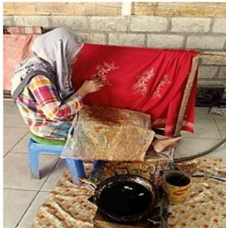
Gambar I.1 Postur Kerja pada proses pencantingan

Pada proses pencantingan di Tatsaka Batik, pekerja melakukan aktivitas selama 9 jam per hari selama 6 hari kerja. Proses ini dimulai dari pukul 07.00 hingga 16.00 WIB. Posisi tubuh dari pekerja bagian pencantingan dilakukan proses secara manual dengan postur kerja yang dilakukan dengan posisi duduk dan tangan digambar pada kain yang diletakkan pada gawangan. Proses ini tidak hanya membutuhkan keterampilan manual yang tinggi tetapi juga ketahanan fisik yang baik untuk menjaga konsistensi dan kualitas hasil akhir. Kondisi tersebut melibatkan pekerjaan selama 9 jam dengan melakukan gerakan yang sama secara berulang. Dalam kondisi kerja pada bagian pencantingan dapat dilihat pada Gambar 1.1.