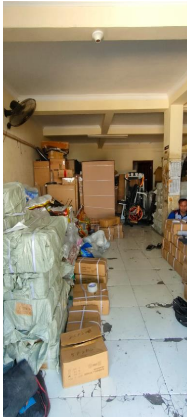
Gambar I. 1 Gudang CV. New Quality

Dapat dilihat pada gambar I.1 kondisi gudang tersebut menunjukkan banyaknya barang-barang kecil yang tidak tertata dengan rapi. Barang-barang tersebut banyak diletakkan di bagian bawah atau lantai gudang. Hal ini menyebabkan pekerja gudang harus membungkuk saat akan mengambil barang-barang tersebut. Posisi penyimpanan barang yang rendah dan tidak teratur ini jelas tidak ergonomis bagi pekerja gudang. Membungkuk secara berulang-ulang dapat menyebabkan risiko cedera pada punggung, leher, dan bahu pekerja. Postur tubuh yang salah seperti ini dapat berkontribusi pada masalah musculoskeletal disorders (MSDs) dan menurunkan produktivitas pekerja. Kondisi gudang CV. New Quality.