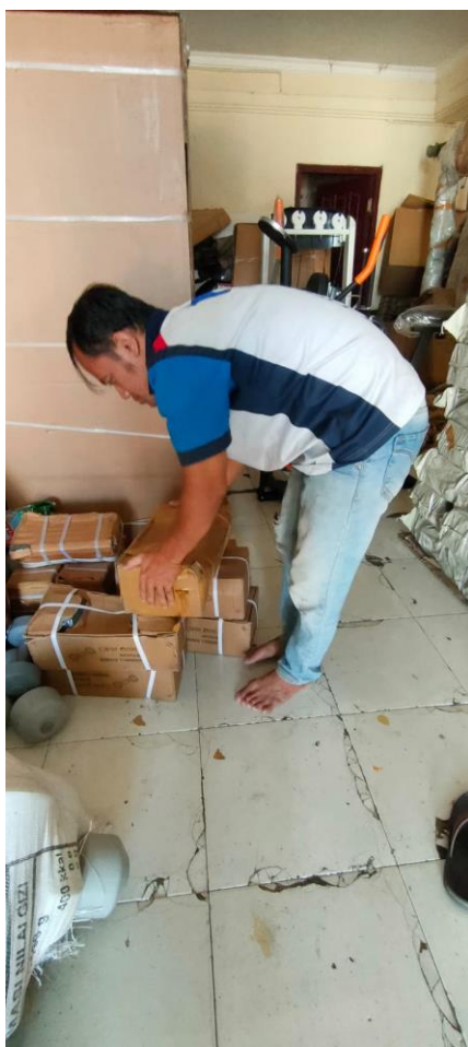
Gambar I. 1 Posisi Mengangkat Salah

Dari gambar I.2 dapat kita lihat bahwa sikap posisi pekerja Gudang saat mengangkat barang salah, dan menurut (Fuad, 2015) sikap posisi kerja yang baik dan benar yaitu pada gambar I.3.