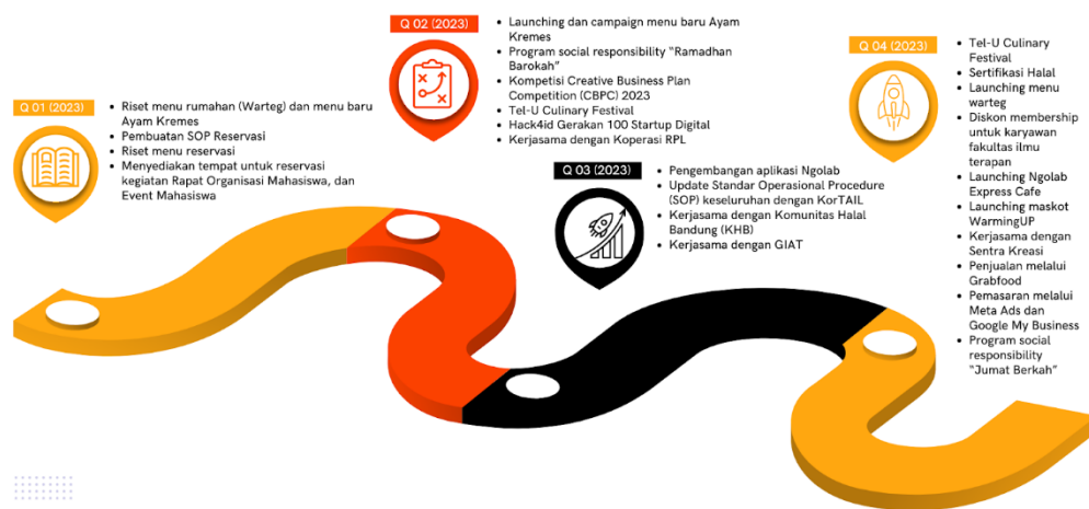
Gambar 1. 3 Peta Jalan Startup Tahun 2023