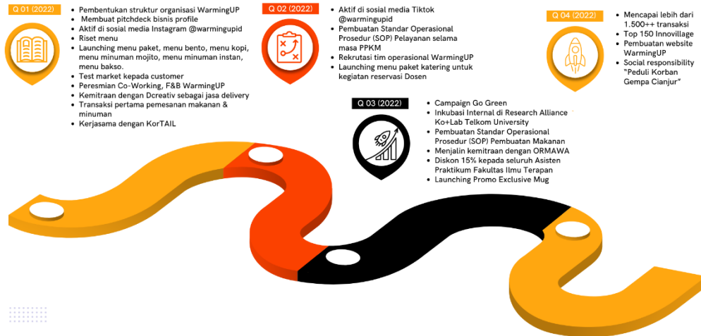
Gambar 1. 2 Peta Jalan Startup Tahun 2022