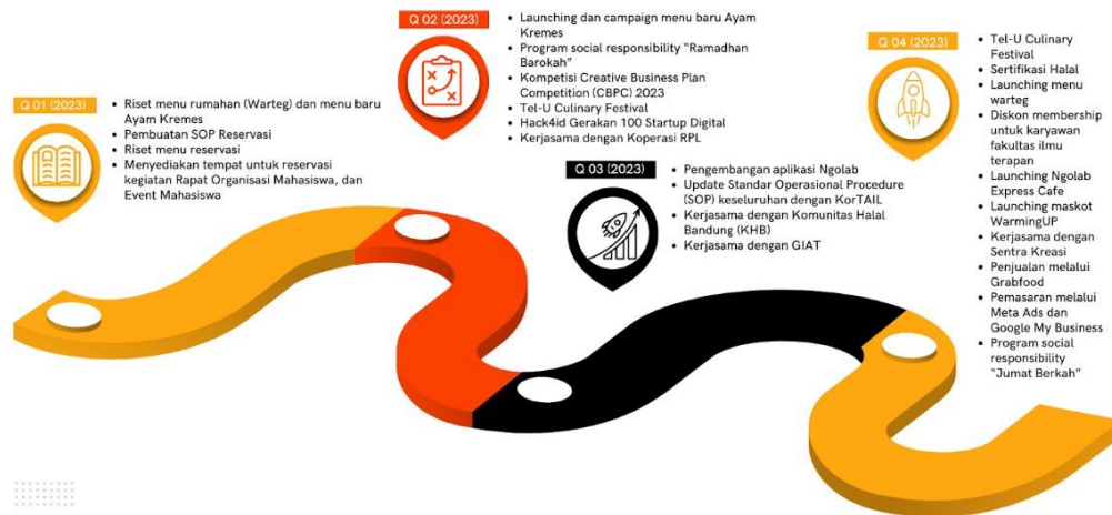
Gambar 1-3 Peta Jalan Startup Tahun 2023