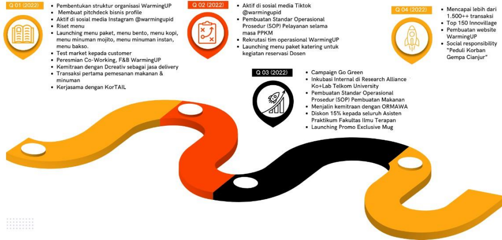
Gambar 1-2 Peta Jalan Startup Tahun 2022