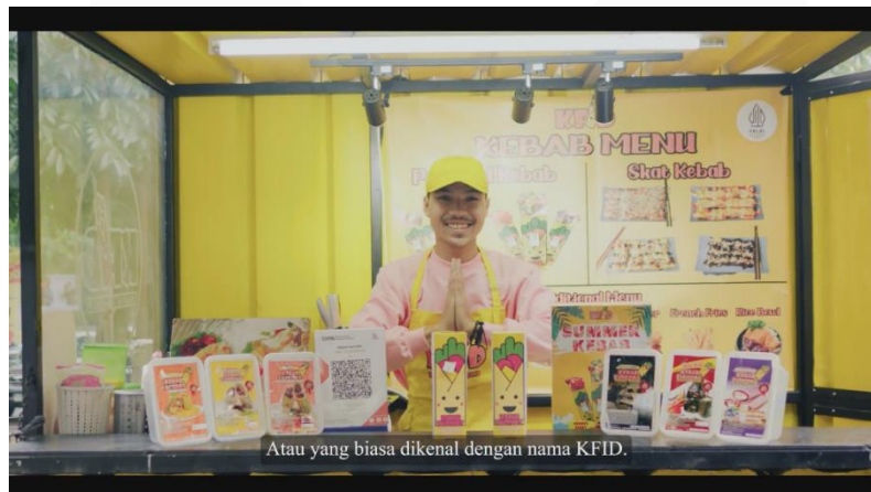
Gambar 4. 3 Composition Sumber: Olahan Penulis

Komposisi dalam pengertian sederhana adalah pengaturan unsur-unsur dalam gambar untuk membentuk kesatuan yang serasi (harmonis) dalam sebuah bingkai (Sari & Abdullah, 2020). Saat menentukan apa yang masuk dan tidak masuk dalam gambar yang dibatasi oleh bingkai dalam viewfinder kamera, itu dinamakan framing.