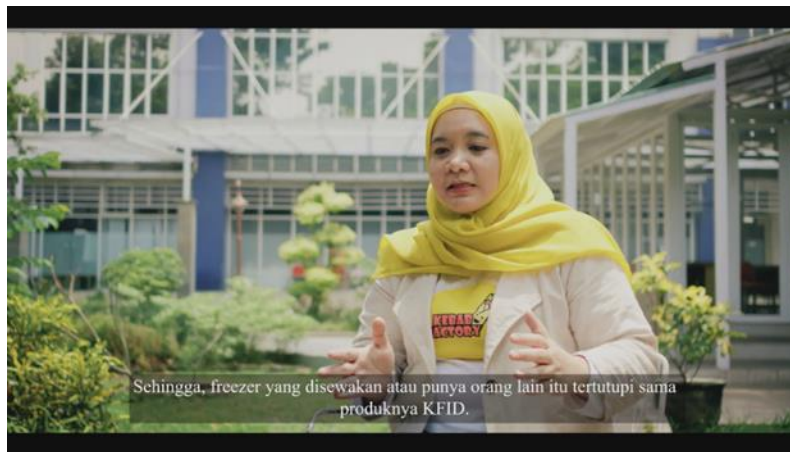
Gambar 4. 1 Low Angle

Camera angle adalah tata letak lensa kamera pada sudut pandang pengambilan gambar yang tepat dan memiliki motivasi khusus untuk membentuk kedalaman dan dimensi gambar, menentukan titik pandang penonton saat melihat adegan, dan membangun kesan psikologis gambar (Sari & Abdullah, 2020),