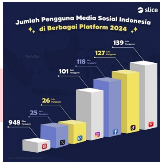
Gambar 1. 1 Data Pengguna Sosial Media

melihat audiens sebagai individu yang memiliki kontrol dan tujuan dalam penggunaan media. Misal dalam kasus yang sedang dibahas adalah dengan adanya company profile yang dibuat akan memenuhi informasi bagi para pelanggan dan calon pelanggan terkait Kebab Factory Id.