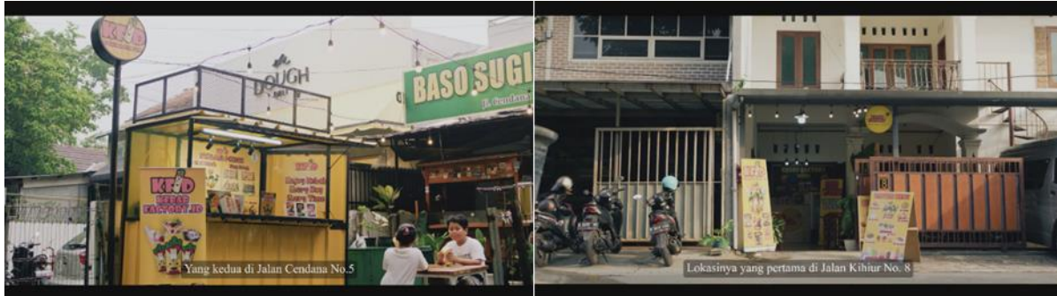
Gambar 4. 2 Continuity

Selain pada fase wawancara, continuity juga dijaga dengan mengambil beberapa footage sesuai dengan apa yang narasumber tuturkan. Hal ini guna menunjukkan secara langsung gambaran yang coba diceritakan oleh narasumber. Seperti contoh pada gambar diatas, narasumber memberikan lokasi dimana outlet kebab factory id berada dan penulis memutuskan untuk mengambil footage dari kedua outlet tersebut guna menjaga Continuity .