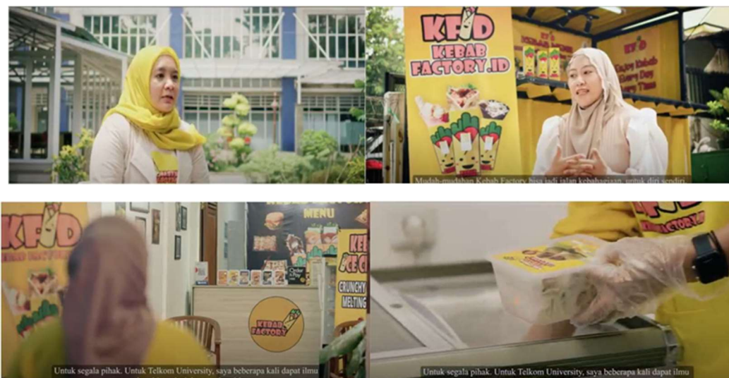
Gambar 4 Phase 4