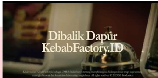
Gambar 1 Opening