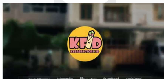
Gambar 5 Penutup

Pendekatan penulis juga melibatkan sudut pandang konsumen untuk memahami harapan mereka terhadap Kebab Factory.ID di masa mendatang. Pendekatan ini memberikan wawasan berharga tentang bagaimana pelanggan melihat dan mengapresiasi inovasi serta kualitas yang ditawarkan oleh Kebab Factory.ID. Ini adalah contoh penerapan pola "Membina Kolaborasi," di mana cerita penyemangat mendorong kerja sama tim dengan membangun narasi bersama tentang pengalaman dan tujuan kelompok. Segmen ini menampilkan wawancara singkat dengan pelanggan setia yang memberikan testimoni positif serta harapan mereka untuk varian rasa baru, peningkatan layanan, dan ekspansi ke berbagai lokasi strategis. Testimoni ini memperkuat pola "Menularkan Nilai - Nilai," di mana cerita digunakan untuk menanamkan nilai-nilai dalam organisasi dan menetapkan ekspektasi terhadap perilaku positif.