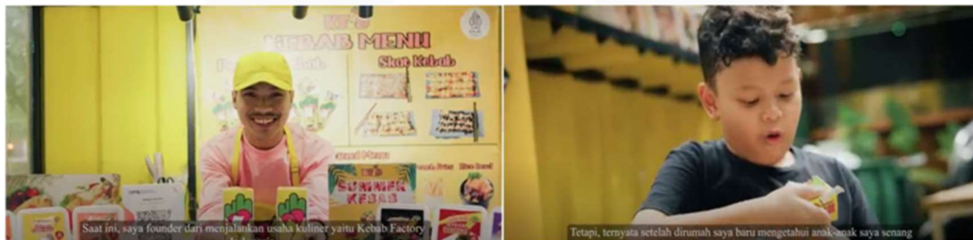
Gambar 2 Phase 1

Video pembuka Kebab Factory.ID adalah contoh yang sangat baik dari storytelling yang efektif. Cuplikan menarik yang disajikan di awal video memberikan gambaran sekilas tentang isi video, dirancang untuk memikat penonton agar semakin tertarik dan penasaran dengan "dapur" Kebab Factory.ID. Teknik ini sejalan dengan pola "Memicu Tindakan" dari storytelling, di mana cerita awal yang relevan dan inspiratif mendorong penonton untuk terus menonton dan mengetahui lebih lanjut tentang bisnis ini.